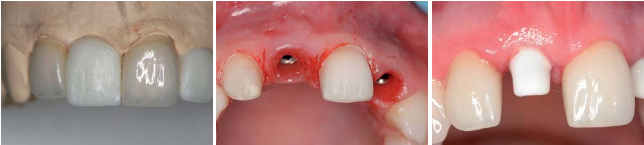
Abb. 13: Fertige provisorische Krone und Veneers. – Abb. 14: Zustand vier Wochen nach Freilegung. – Abb. 15: Einprobe Zirkon-Abutment 11.