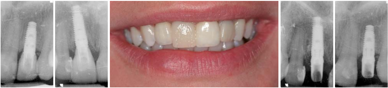
Abb. 19: Zahn 22 Provisorium nach Freilegung. – Abb. 20: Zahn 11 Provisorium nach Freilegung. – Abb. 21: Veneers und provisorische Krone eingesetzt nach Freilegung. – Abb. 22: Zahn 11 Abutment Einprobe. – Abb. 23: Zahn 22 Abutment Einprobe.