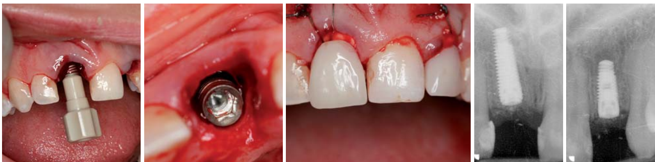
Abb. 5: Implantatinserterion Zahn 11. – Abb. 6: Implantat Zahn 11 inseriert. – Abb. 7: Provisorium und GTR. – Abb. 8: Zahn 11 post OP. – Abb. 9: Zahn 22 post OP.