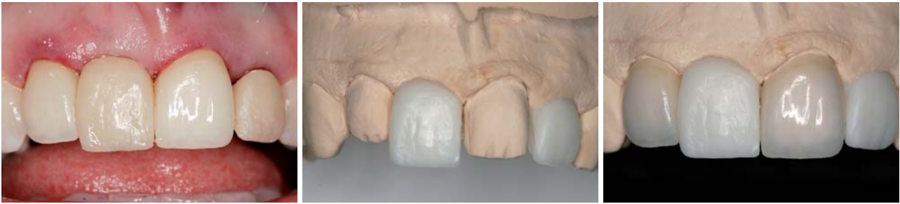
Abb. 10: Zustand drei Wochen post OP. – Abb. 11: Provisorische Krone auf dem Modell. – Abb. 12: Veneers Rohbrand.