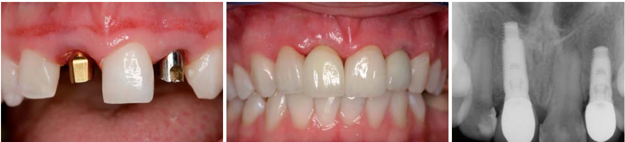
Abb. 24: Abutments und fertiger Zahnersatz. – Abb. 25: Fertiger Zahnersatz. – Abb. 26: Kontrolle Zähne 11, 22 und Zahnersatz.

befestigt, damit keine Zement-reste subgingival verbleiben. Die Konditionierung des Zahnfleisches wurde also ohne Gingivaformer mit der Abutment-Kronen-Einheit durchgeführt. Provisorisches Abutment und provisorische Krone wurden für vier Wochen eingesetzt, um das Emergenzprofil aufzubauen.