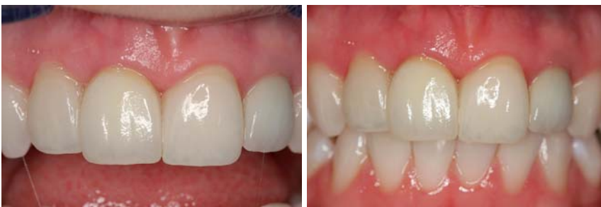
Abb. 27: Drei Monate nach Einsetzen des Zahnersatzes ... – Abb. 28: ... Okklusion.

Beim Einsetzen der fertigen Kronen wurden mehrere Zahnfilme angefertigt, um zum einen den Sitz der Abutments und der Kronen zu kontrollieren und zum anderen Zementreste subgingival auszuschließen. Die Bilder der eingesetzten Kronen zeigen ein ästhetisches Ergebnis, sowohl in Bezug auf die Kronen als auch in Bezug auf das Weichgewebe. Vier Wochen nach dem Einsetzen zeigen die Bilder ein verbessertes Bild in Bezug auf das Weichgewebe.