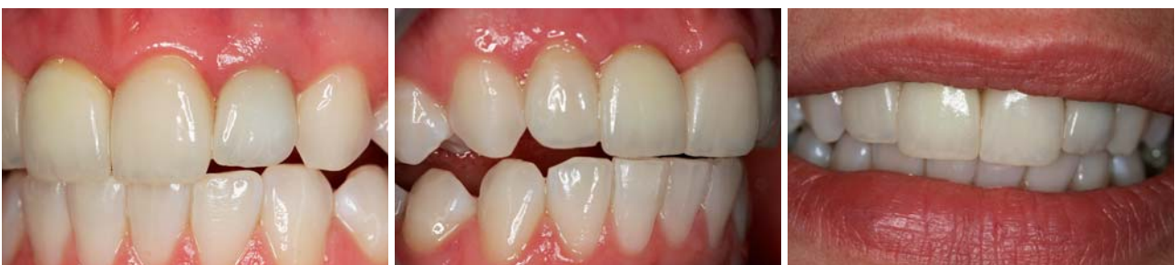
Abb. 29: ... links. – Abb. 30: ... rechts. – Abb. 31: ... lächelnd.