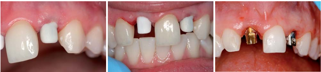
Abb. 16: Einprobe Zirkon-Abutment 22. – Abb. 17: Zirkonkappen in Occlusion. – Abb. 18: Gewebequalität vier Wochen nach Einsatz Provisorium.